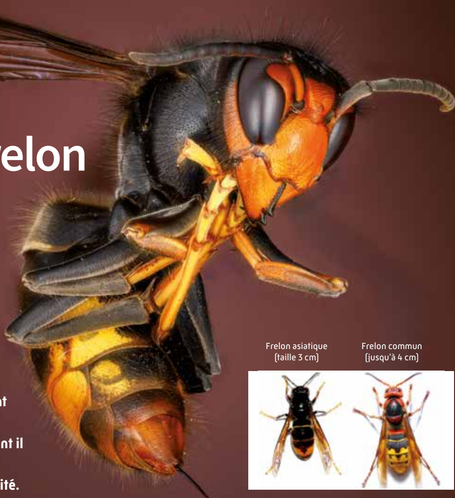
Frelon asiatique (taille 3 cm)

Cette année, en Isère, le frelon asiatique a occasionné d'énormes dégâts sur les ruchers en se nourrissant des abeilles mais également en s'attaquant à l'ensemble des insectes pollinisateurs et aux fruits dont il aime se nourrir. C'est une catastrophe pour la biodiversité.