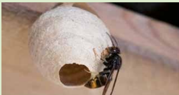
Nid primaire de 1 mois.