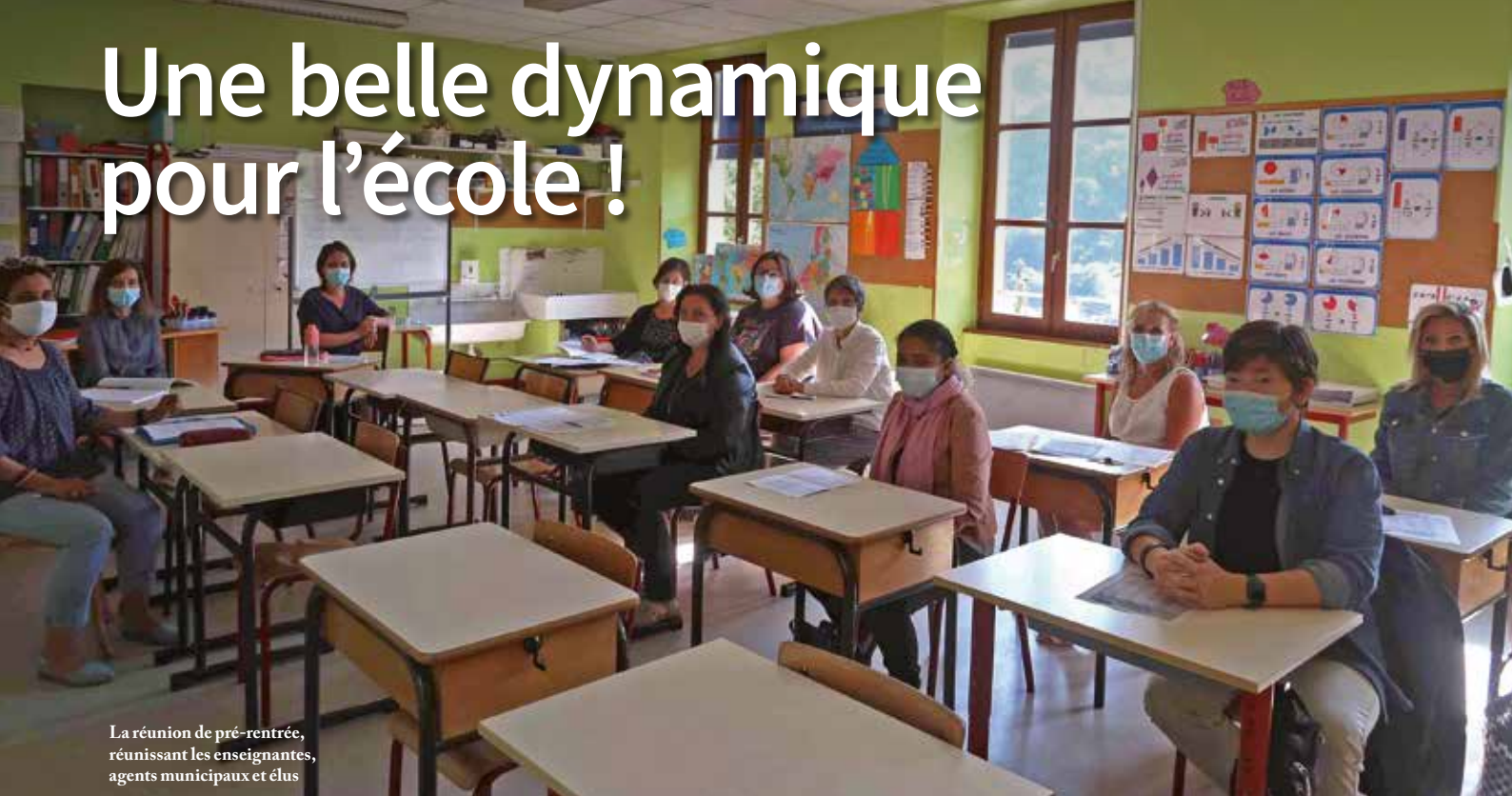
La réunion de pré-rentree, réunissant les enseignantes, agents municipaux et élus